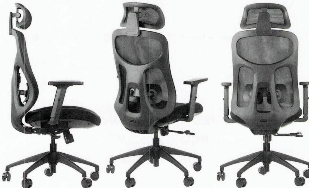
Fot. 1. Linia krzeseł biurowych obrotowych ARDEN

Krzeseła obrotowe serii ARDEN to krzeseła na amortyzatorze gazowym z oparciem połączonym z siedziskiem przy wykorzystaniu synchronizmu, który w połączeniu z możliwością regulacji wysokości siedziska i podparcia lędźwiowego oraz kąta nachylenia oparcia, a także odpowiednimi profilami siedziska i oparcia zapewnia możliwość dostosowania warunków siedzenia do anatomicznych potrzeb użytkowników. Zastosowane mechanizmy umożliwiają siedzenie dynamiczne i przyjmowanie zrelaksowanej, odchylonej do tyłu pozycji ciała.